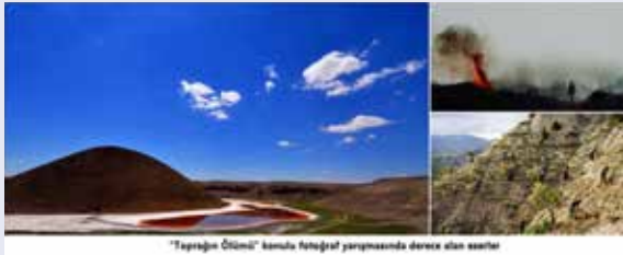
“Toprağın Ölümü” konulu fotoğraf yarışmasında derece alan eserler

Amacı; Gezegenimizde toprağın tahribi ile oluşacak toprak ölümü ve bundan etkilenen canlıların sorunlarına ve ölümlerine toplumun dikkatini çekmek ve çevre bilincinin gelişmesine katkıda bulunmak ve insanoğlunun, yaşamımızda önemli yer tutan toprağa ve canlılara verdiği zararları göz önüne sermek olan yarışmaya 118 fotoğraf sanatçısı 462 eserle katıldı.