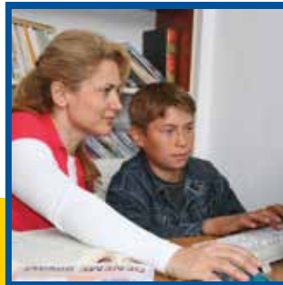
Lions Quest Doğu Avrupa'da Genişlemeye Devam Ediyor