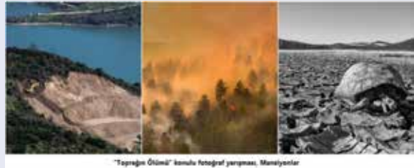
“Toprağın Ölümü” konulu fotoğraf yarışması, Mansiyonlar

Yarışmada birinciliği alan fotoğraf sanatçısı Birol Kırac'a ait olan eser, Konya Karapınar'da bulunan ve bir volkan kraterinin su ile dolması sonucu oluşan Meke Gölü'nün çevredeki yanlış sanayileşme sonucunda kurumuş halini sergiliyor.