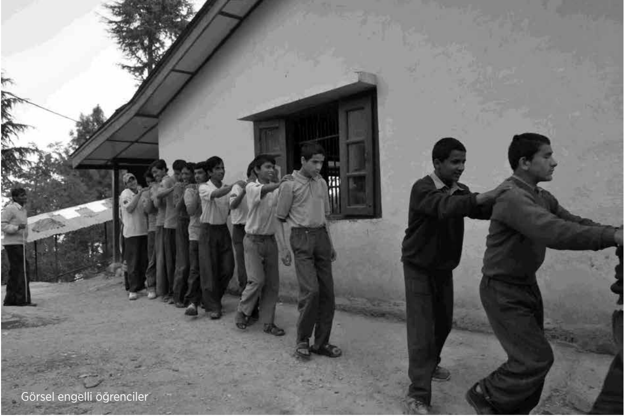
Görsel engelli öğrenciler