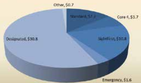
Dağıtılan Bağış Tipleri