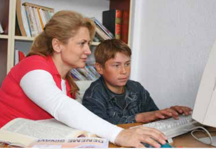
Lions Quest Programının Türkiye'de uygulaması.

T üm dünyadaki her yaşta öğrenciler benzer sorunlarla mücadele ediyor: kabadayılık, yaşitlerinin baskıları, madde bağımlılığı ve zarar verici diğer alışkanlıklar. Ancak Lion'ların sağladığı bir çözüm var: Lions Quest, LCIF'in önerdiği, sosyal ve duygusal yönden genç olma yolunda yeni bir okul yaklaşımı getiren, yaşam becerileri programı.