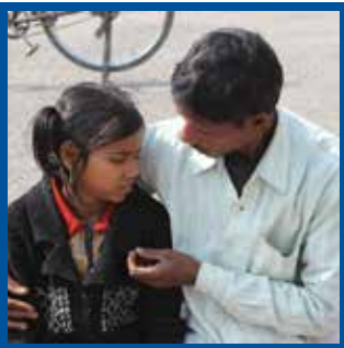
Yaşamları Dönüştürmek için LCIF'in Muhteşem Olduğu Dört Yol